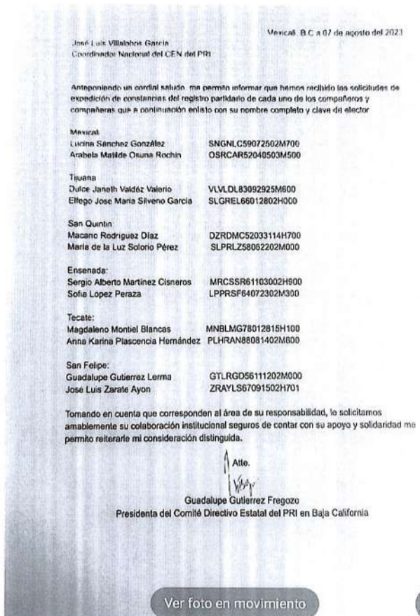
Ilustración 1 Petición de la Presidenta del CDE a solo unos militantes

Tenemos la certeza que dicho documento fue valido solamente para aquellas formulas que si acreditaron todos los requisitos, y cuyo registro fue procedente por parte de la comisión estatal de Procesos Internos.